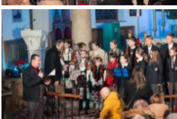
• 2025-02-02- XIV Rabczańskie Kołędowanie