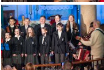
• 2025-02-02- XIV Rabczańskie Kołędowanie