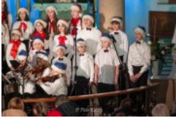
• 2025-02-02- XIV Rabczańskie Kołędowanie