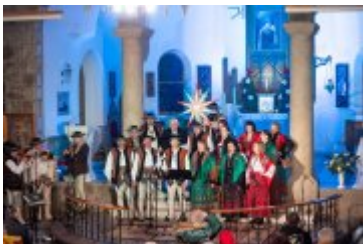
• 2025-02-02- XIV Rabczańskie Kołędowanie