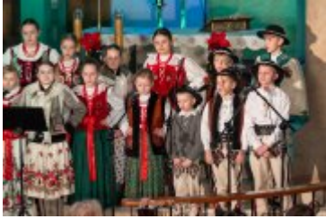
• 2025-02-02- XIV Rabczańskie Kołędowanie