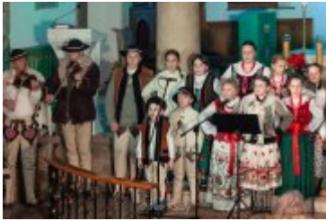
• 2025-02-02- XIV Rabczańskie Kołędowanie