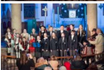
• 2025-02-02- XIV Rabczańskie Kołędowanie