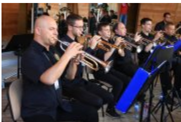
• 2019-08-09-Koncert Orkiestry Dętej Corpo Musicale Olgiate