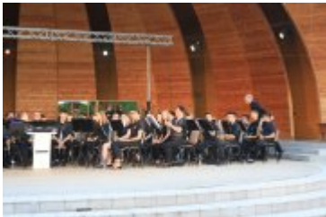
• 2019-08-09-Koncert Orkiestry Dętej Corpo Musicale Olgiate