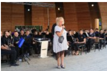
• 2019-08-09-Koncert Orkiestry Dętej Corpo Musicale Olgiate