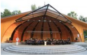
• 2019-08-09-Koncert Orkiestry Dętej Corpo Musicale Olgiate