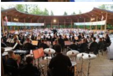
• 2019-08-09-Koncert Orkiestry Dętej Corpo Musicale Olgiate