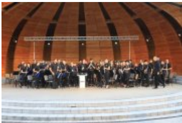
• 2019-08-09-Koncert Orkiestry Dętej Corpo Musicale Olgiate