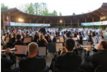
• 2019-08-09-Koncert Orkiestry Dętej Corpo Musicale Olgiate