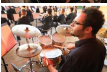
• 2019-08-09-Koncert Orkiestry Dętej Corpo Musicale Olgiate