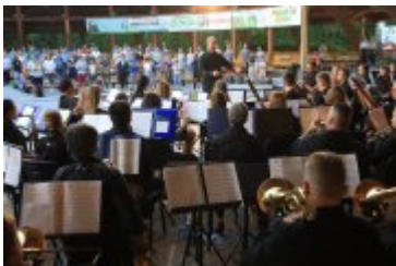
• 2019-08-09-Koncert Orkiestry Dętej Corpo Musicale Olgiate