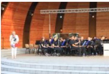
• 2019-08-09-Koncert Orkiestry Dętej Corpo Musicale Olgiate