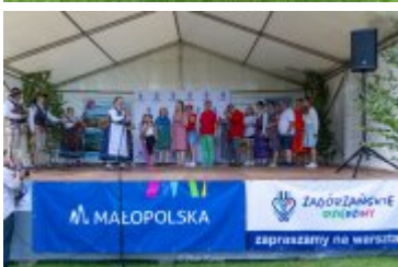
• 2024-07-06-Zagórzański Festiwal Folkloru i Tradycji