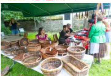
• 2024-07-06-Zagórzeński Festiwal Folkloru i Tradycji