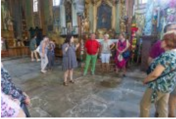
• 2024-07-06-Zagórzański Festiwal Folkloru i Tradycji