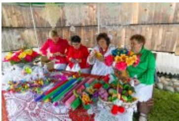
• 2024-07-06-Zagórzański Festiwal Folkloru i Tradycji