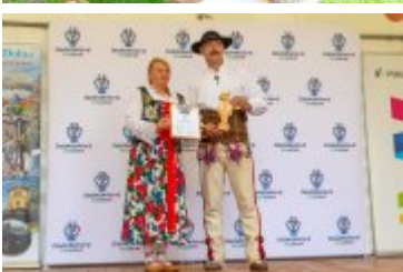
• 2024-07-06-Zagórzeński Festiwal Folkloru i Tradycji