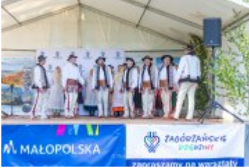
• 2024-07-06-Zagórzański Festiwal Folkloru i Tradycji