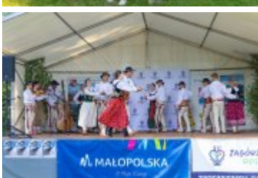
2024-07-06-Zagórzański Festiwal Folkloru i Tradycji