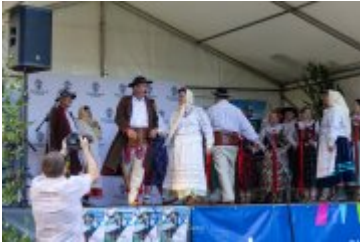
• 2024-07-06-Zagórzański Festiwal Folkloru i Tradycji