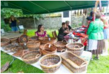
• 2024-07-06-Zagórzeński Festiwal Folkloru i Tradycji