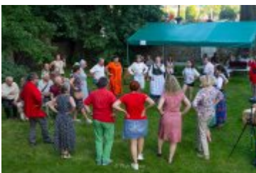
• 2024-07-06-Zagórzański Festiwal Folkloru i Tradycji