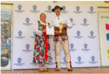
• 2024-07-06-Zagórzeński Festiwal Folkloru i Tradycji