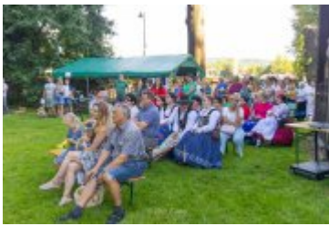
2024-07-06-Zagórzański Festiwal Folkloru i Tradycji