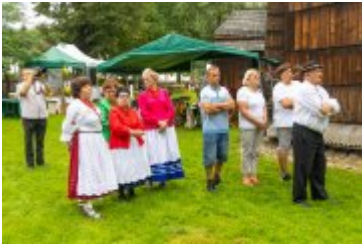
• 2024-07-06-Zagórzeński Festiwal Folkloru i Tradycji