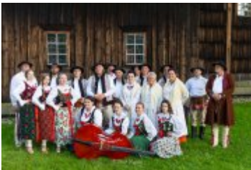
• 2024-07-06-Zagórzański Festiwal Folkloru i Tradycji