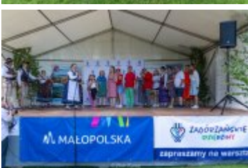
• 2024-07-06-Zagórzański Festiwal Folkloru i Tradycji