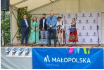
• 2024-07-06-Zagórzeński Festiwal Folkloru i Tradycji