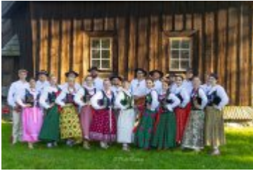
• 2024-07-06-Zagórzański Festiwal Folkloru i Tradycji