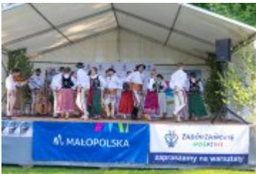
• 2024-07-06-Zagórzański Festiwal Folkloru i Tradycji