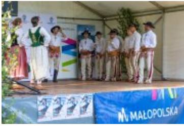
2024-07-06-Zagórzański Festiwal Folkloru i Tradycji