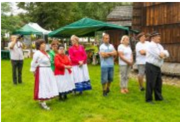
• 2024-07-06-Zagórzeński Festiwal Folkloru i Tradycji