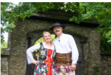
• 2024-07-06-Zagórzeński Festiwal Folkloru i Tradycji