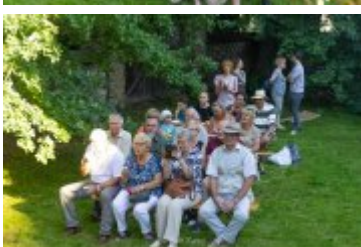
2024-07-06-Zagórzański Festiwal Folkloru i Tradycji