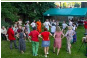
• 2024-07-06-Zagórzański Festiwal Folkloru i Tradycji