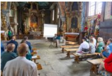
• 2024-07-06-Zagórzeński Festiwal Folkloru i Tradycji