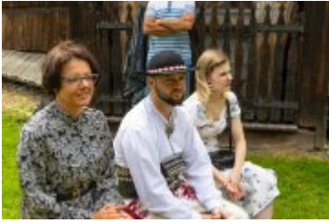
• 2024-07-06-Zagórzeński Festiwal Folkloru i Tradycji