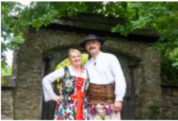
• 2024-07-06-Zagórzeński Festiwal Folkloru i Tradycji