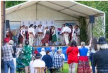
• 2024-07-06-Zagórzański Festiwal Folkloru i Tradycji