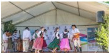
2024-07-06-Zagórzański Festiwal Folkloru i Tradycji