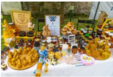
• 2024-07-06-Zagórzański Festiwal Folkloru i Tradycji