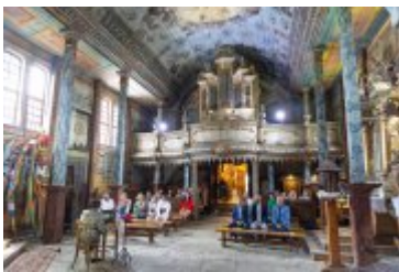
• 2024-07-06-Zagórzański Festiwal Folkloru i Tradycji