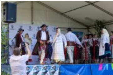
• 2024-07-06-Zagórzański Festiwal Folkloru i Tradycji