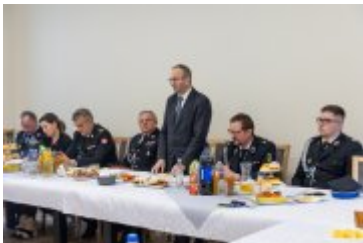
• 2025-02-16- Zebranie sprawozdawcze w OSP Ponice