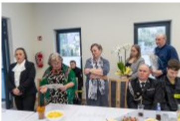
• 2025-02-16- Zebranie sprawozdawcze w OSP Ponice