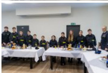
• 2025-02-16- Zebranie sprawozdawcze w OSP Ponice