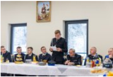
• 2025-02-16- Zebranie sprawozdawcze w OSP Ponice