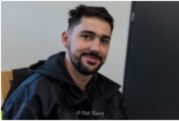
• 2025-02-16- Zebranie sprawozdawcze w OSP Ponice