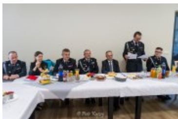
• 2025-02-16- Zebranie sprawozdawcze w OSP Ponice