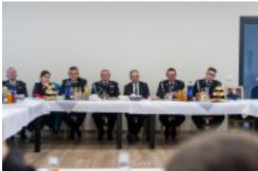
• 2025-02-16- Zebranie sprawozdawcze w OSP Ponice