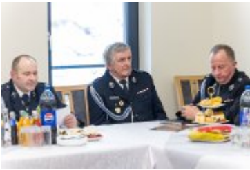
• 2025-02-16- Zebranie sprawozdawcze w OSP Ponice