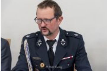
• 2025-02-16- Zebranie sprawozdawcze w OSP Ponice