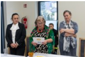
• 2025-02-16- Zebranie sprawozdawcze w OSP Ponice