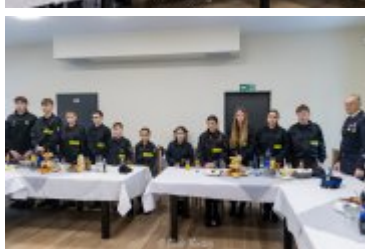
• 2025-02-16- Zebranie sprawozdawcze w OSP Ponice