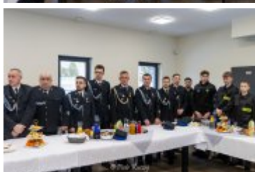
• 2025-02-16- Zebranie sprawozdawcze w OSP Ponice