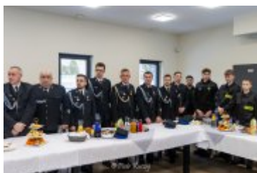
• 2025-02-16- Zebranie sprawozdawcze w OSP Ponice