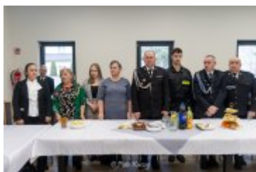
• 2025-02-16- Zebranie sprawozdawcze w OSP Ponice