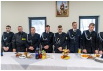
• 2025-02-16- Zebranie sprawozdawcze w OSP Ponice