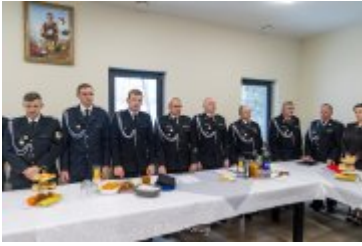
• 2025-02-16- Zebranie sprawozdawcze w OSP Ponice