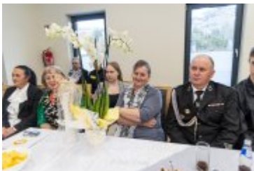
• 2025-02-16- Zebranie sprawozdawcze w OSP Ponice