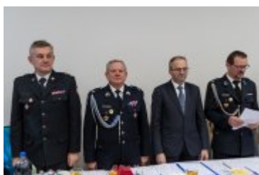
• 2025-02-16- Zebranie sprawozdawcze w OSP Ponice