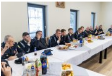
• 2025-02-16- Zebranie sprawozdawcze w OSP Ponice