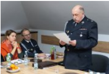
• 2024-01-04-Zebranie sprawozdawcze jednostki OSP w Chabówce