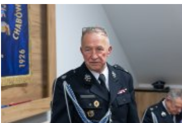
• 2024-01-04-Zebranie sprawozdawcze jednostki OSP w Chabówce