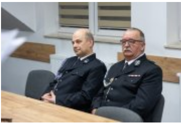
• 2024-01-04-Zebranie sprawozdawcze jednostki OSP w Chabówce