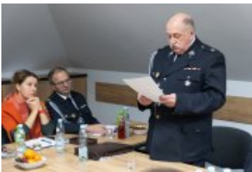
• 2024-01-04-Zebranie sprawozdawcze jednostki OSP w Chabówce