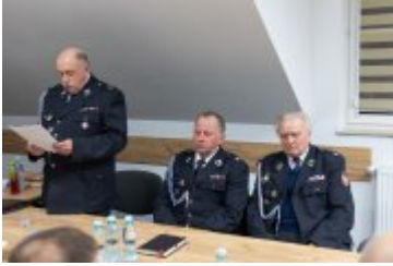
• 2024-01-04-Zebranie sprawozdawcze jednostki OSP w Chabówce