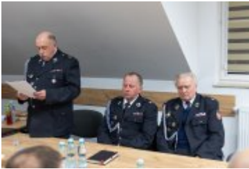
• 2024-01-04-Zebranie sprawozdawcze jednostki OSP w Chabówce