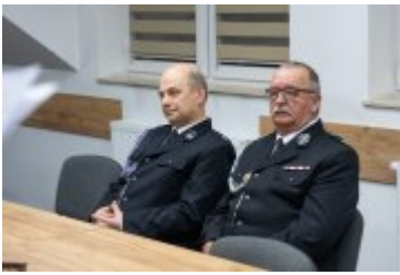
• 2024-01-04-Zebranie sprawozdawcze jednostki OSP w Chabówce