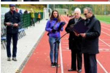
• 2021-1023-Uroczyste otwarcie Stadionu Miejskiego im. A. Matery