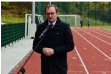
• 2021-1023-Uroczyste otwarcie Stadionu Miejskiego im. A. Matery