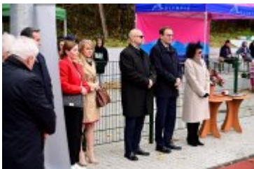
• 2021-1023-Uroczyste otwarcie Stadionu Miejskiego im. A. Matery