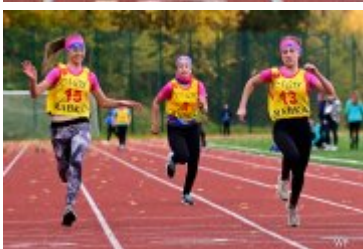
2021-1023-Uroczyste otwarcie Stadionu Miejskiego im. A. Matery