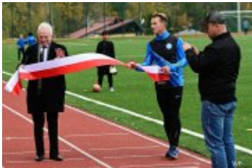
• 2021-1023-Uroczyste otwarcie Stadionu Miejskiego im. A. Matery