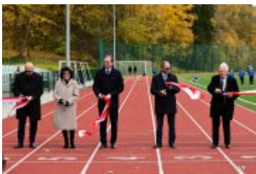
• 2021-1023-Uroczyste otwarcie Stadionu Miejskiego im. A. Matery