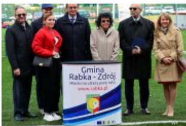
2021-1023-Uroczyste otwarcie Stadionu Miejskiego im. A. Matery