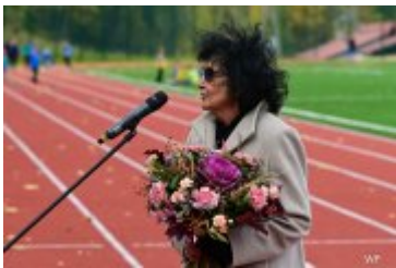
2021-1023-Uroczyste otwarcie Stadionu Miejskiego im. A. Matery