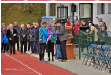
• 2021-1023-Uroczyste otwarcie Stadionu Miejskiego im. A. Matery