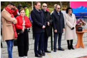
• 2021-1023-Uroczyste otwarcie Stadionu Miejskiego im. A. Matery