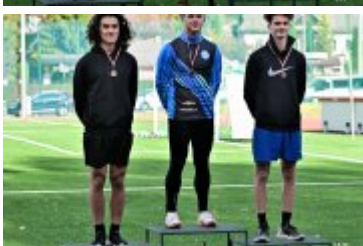
• 2021-1023-Uroczyste otwarcie Stadionu Miejskiego im. A. Matery