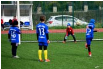
• 2021-1023-Uroczyste otwarcie Stadionu Miejskiego im. A. Matery