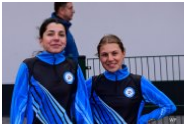
• 2021-1023-Uroczyste otwarcie Stadionu Miejskiego im. A. Matery