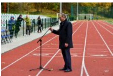
• 2021-1023-Uroczyste otwarcie Stadionu Miejskiego im. A. Matery