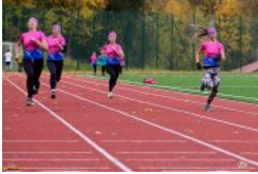
• 2021-1023-Uroczyste otwarcie Stadionu Miejskiego im. A. Matery