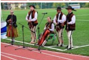
• 2021-1023-Uroczyste otwarcie Stadionu Miejskiego im. A. Matery