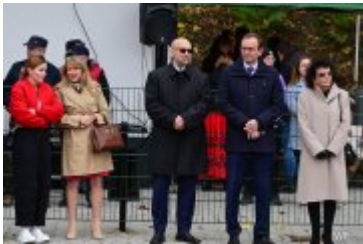
• 2021-1023-Uroczyste otwarcie Stadionu Miejskiego im. A. Matery