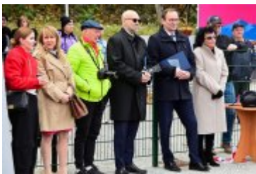
2021-1023-Uroczyste otwarcie Stadionu Miejskiego im. A. Matery