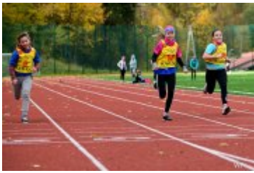
• 2021-1023-Uroczyste otwarcie Stadionu Miejskiego im. A. Matery