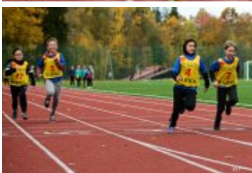
2021-1023-Uroczyste otwarcie Stadionu Miejskiego im. A. Matery