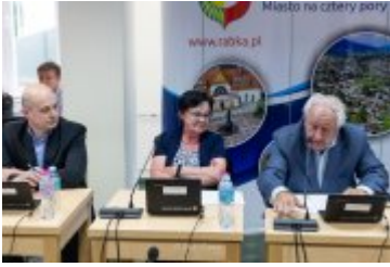
• 2024-05-17- II sesja Rady Miejskiej