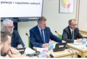
• 2024-05-17- II sesja Rady Miejskiej