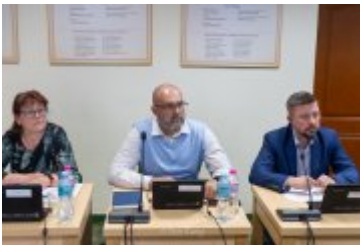
• 2024-05-17- II sesja Rady Miejskiej