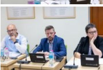
• 2024-05-17- II sesja Rady Miejskiej