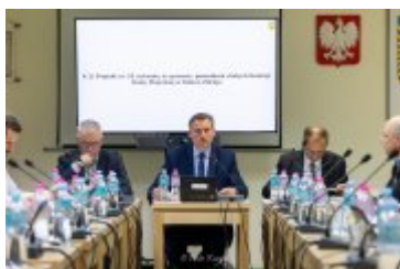
2024-05-17- II sesja Rady Miejskiej