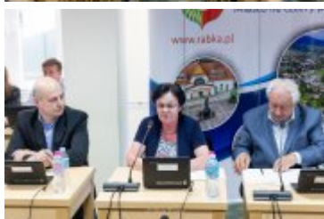
2024-05-17- II sesja Rady Miejskiej