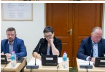
• 2024-05-17- II sesja Rady Miejskiej