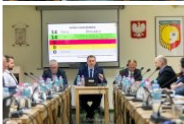
2024-05-17- II sesja Rady Miejskiej