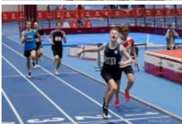
• 2025-02-11- Halowe Mistrzostwa Małopolski Juniorów