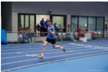
• 2025-02-11- Halowe Mistrzostwa Małopolski Juniorów