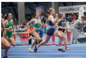
2025-02-11- Halowe Mistrzostwa Małopolski Juniorów