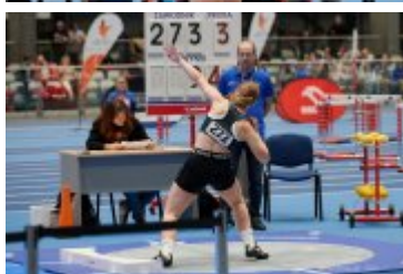
2025-02-11- Halowe Mistrzostwa Małopolski Juniorów