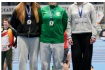
2025-02-11- Halowe Mistrzostwa Małopolski Juniorów