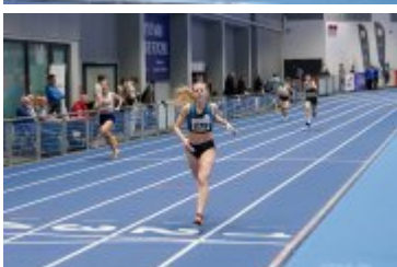
• 2025-02-11- Halowe Mistrzostwa Małopolski Juniorów