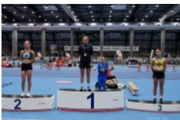
• 2025-02-11- Halowe Mistrzostwa Małopolski Juniorów