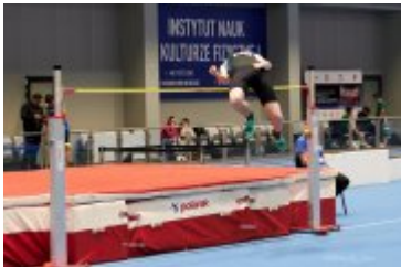
• 2025-02-11- Halowe Mistrzostwa Małopolski Juniorów