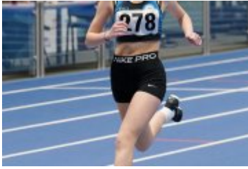
• 2025-02-11- Halowe Mistrzostwa Małopolski Juniorów