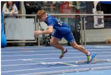
• 2025-02-11- Halowe Mistrzostwa Małopolski Juniorów