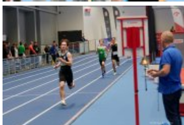
2025-02-11- Halowe Mistrzostwa Małopolski Juniorów