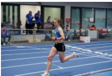
• 2025-02-11- Halowe Mistrzostwa Małopolski Juniorów