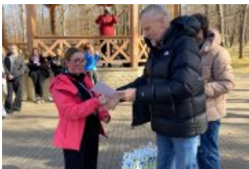
• 2025-03-04- Projekt "Żołnierze Niezlomni" w ZSU w Rabce