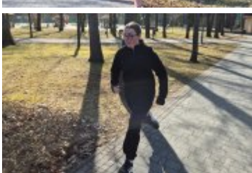
• 2025-03-04- Projekt "Żołnierze Niezłomni" w ZSU w Rabce