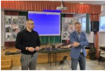
• 2025-03-04- Projekt "Żołnierze Niezłomni" w ZSU w Rabce