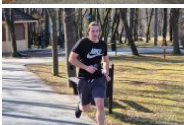
• 2025-03-04- Projekt "Żołnierze Niezłomni" w ZSU w Rabce