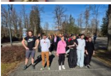
• 2025-03-04- Projekt "Żołnierze Niezłomni" w ZSU w Rabce