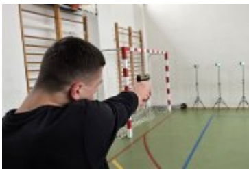
• 2025-03-04- Projekt "Żołnierze Niezłomni" w ZSU w Rabce