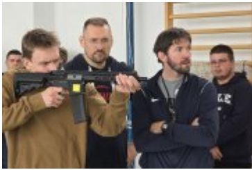
• 2025-03-04- Projekt "Żołnierze Niezłomni" w ZSU w Rabce