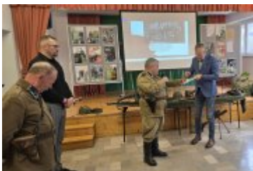
• 2025-03-04- Projekt "Żołnierze Niezłomni" w ZSU w Rabce