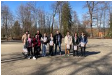
• 2025-03-04- Projekt "Żołnierze Niezlomni" w ZSU w Rabce