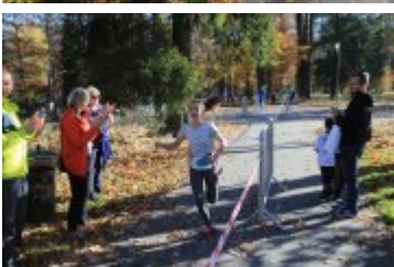
2019-10-20-Perły Małopolski-cz. 1