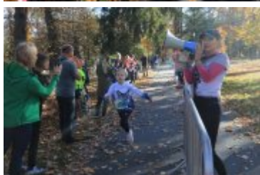
2019-10-20-Perły Małopolski-cz. 1