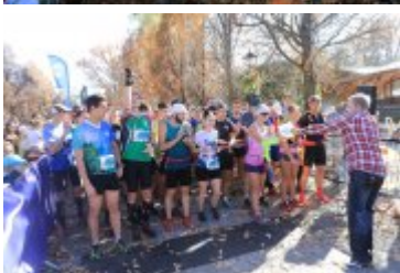
2019-10-20-Perły Małopolski-cz. 1