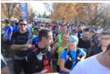
2019-10-20-Perły Małopolski-cz. 1