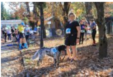
2019-10-20-Perły Małopolski-cz. 1