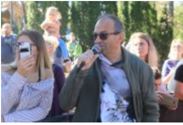
2019-10-20-Perły Małopolski-cz. 1