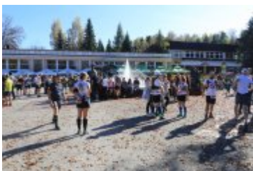
• 2019-10-20-Perły Małopolski-cz. 1