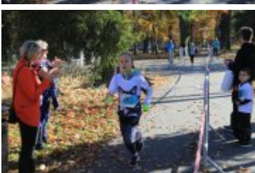
2019-10-20-Perły Małopolski-cz. 1