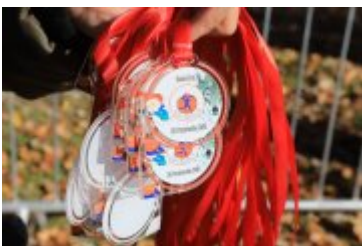
2019-10-20-Perły Małopolski-cz. 1