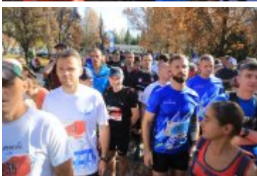
2019-10-20-Perły Małopolski-cz. 1