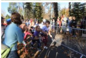
2019-10-20-Perły Małopolski-cz. 1