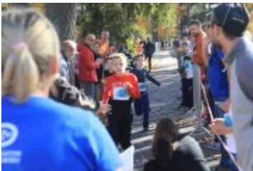
2019-10-20-Perły Małopolski-cz. 1