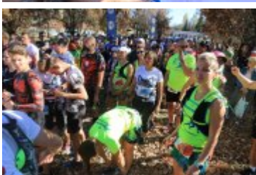
2019-10-20-Perły Małopolski-cz. 1