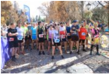
2019-10-20-Perły Małopolski-cz. 1