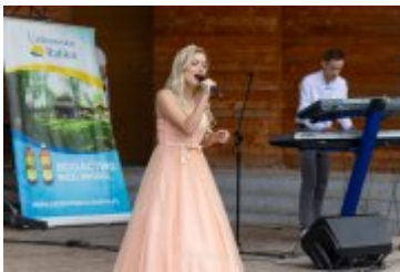
• 2024-06-03- Dzień Dziecka w Rabce-Zdroju cz.2