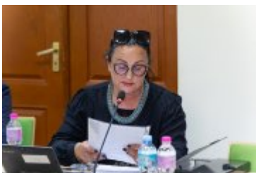
• 2024-05-28-III Sesja Rady Miejskiej w Rabce-Zdroju