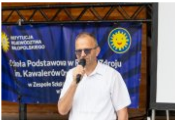
• 2024-06-03- Dzień Dziecka w Rabce-Zdroju cz.2