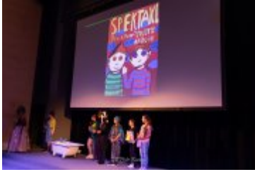
• 2024-06-03- Dzień Dziecka w Rabce-Zdroju cz.1