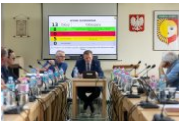
• 2024-05-28-III Sesja Rady Miejskiej w Rabce-Zdroju