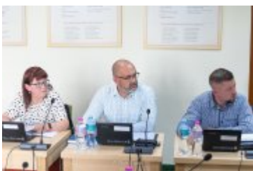
• 2024-05-28-III Sesja Rady Miejskiej w Rabce-Zdroju