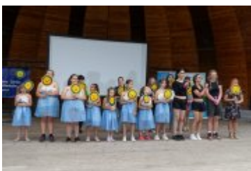
• 2024-06-03- Dzień Dziecka w Rabce-Zdroju cz.2