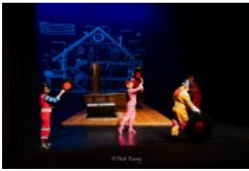
• 2024-06-03- Dzień Dziecka w Rabce-Zdroju cz.1