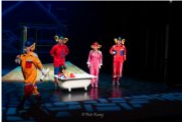
• 2024-06-03- Dzień Dziecka w Rabce-Zdroju cz.1