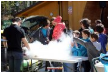
• 2017-05-01-Rodzinny Piknik Naukowy w Amfiteatrze