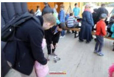
• 2017-05-01-Rodzinny Piknik Naukowy w Amfiteatrze