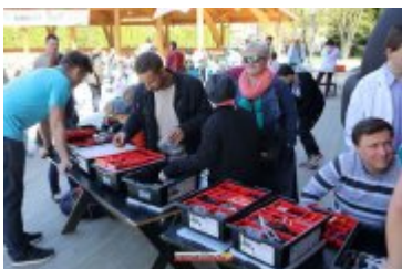
• 2017-05-01-Rodzinny Piknik Naukowy w Amfiteatrze