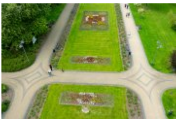
• 2024-05-29-Rabczański Park Zdrojowy pełen tysięcy kwiatów!