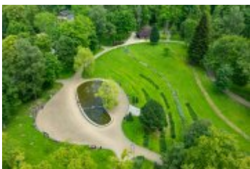
• 2024-05-29-Rabczański Park Zdrojowy pełen tysięcy kwiatów!