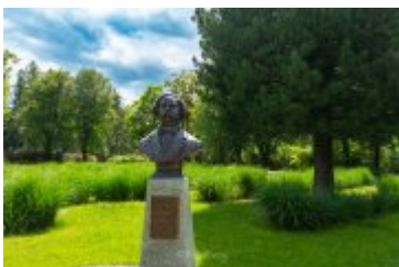
• 2024-05-29-Rabczański Park Zdrojowy pełen tysięcy kwiatów!