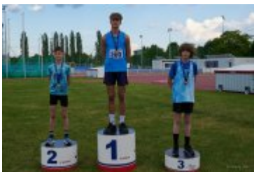
• 2024-05-27-Mistrzostwa Małopolski w dwubojach