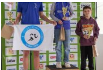
• 2024-04-14-Mistrzostwa Polski w Biegach Górskich