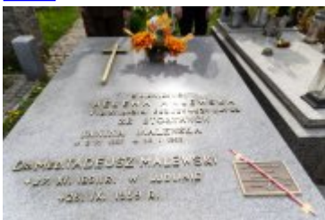
• 2024-04-15-Rocznica Zbrodni Katyńskiej i Tragedii Smoleńskiej