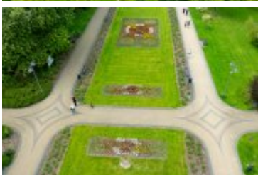
• 2024-05-29-Rabczański Park Zdrojowy pełen tysięcy kwiatów!