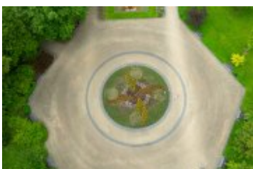
• 2024-05-29-Rabczański Park Zdrojowy pełen tysięcy kwiatów!