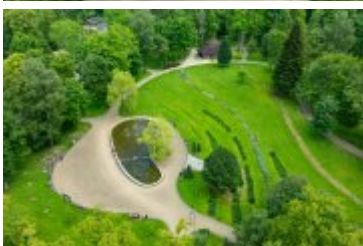
• 2024-05-29-Rabczański Park Zdrojowy pełen tysięcy kwiatów!