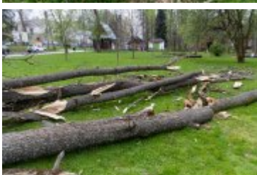
• 2024-04-11-Wycinka chorych drzew w Parku Zdrojowym