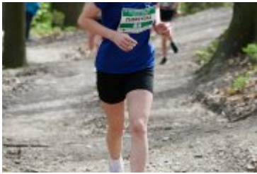
• 2024-04-14-Mistrzostwa Polski w Biegach Górskich