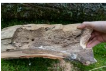
• 2024-04-11-Wycinka chorych drzew w Parku Zdrojowym