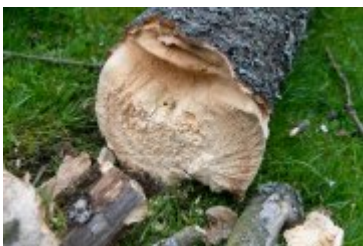
• 2024-04-11-Wycinka chorych drzew w Parku Zdrojowym