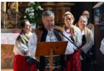
• 2024-04-14-"Święcone" u Podhalan