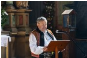
• 2024-04-14-"Święcone" u Podhalan