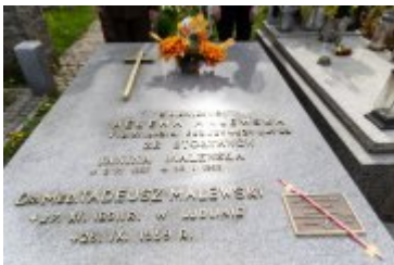
• 2024-04-15-Rocznica Zbrodni Katyńskiej i Tragedii Smoleńskiej