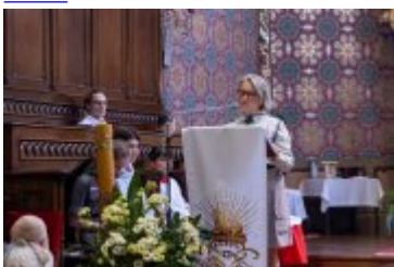
• 2024-04-15-Rocznica Zbrodni Katyńskiej i Tragedii Smoleńskiej