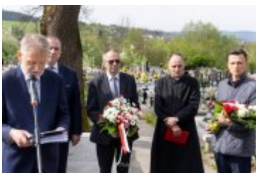
• 2024-04-15-Rocznica Zbrodni Katyńskiej i Tragedii Smoleńskiej