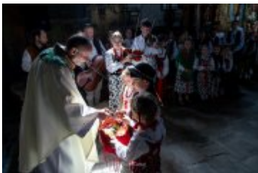
• 2024-04-14-"Święcone" u Podhalan