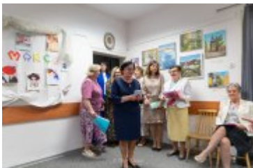
2024-03-06-Dzień Kobiet w RUTW