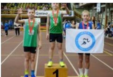
2024-03-06-Zawodnicy UKS Romer na Halowych Mistrzostw