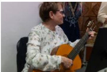
2024-03-06-Dzień Kobiet w RUTW