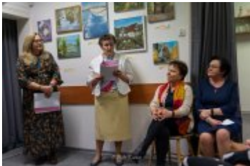
2024-03-06-Dzień Kobiet w RUTW