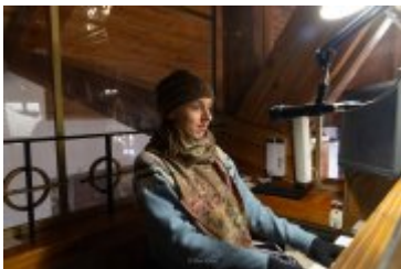
• 2024-02-02-XIII Rabczańskie Kołędowanie