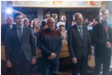
• 2024-02-02-XIII Rabczańskie Kołędowanie