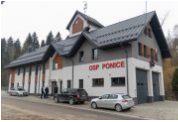
• 2024-02-11-Walne zebranie w OSP Ponice