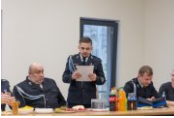
• 2024-02-11-Walne zebranie w OSP Ponice