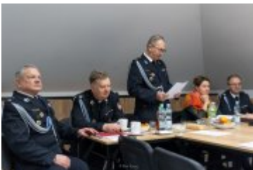
• 2024-01-04-Zebranie sprawozdawcze jednostki OSP w Chabówce