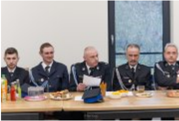
• 2024-02-11-Walne zebranie w OSP Ponice