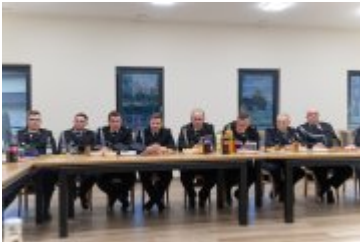
• 2024-02-11-Walne zebranie w OSP Ponice