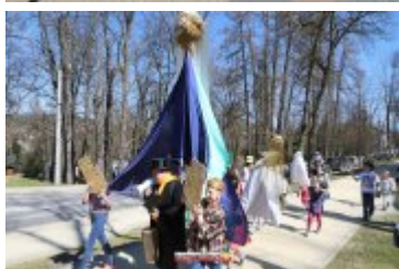
• 2017-04-01-Teatralne powitanie wiosny