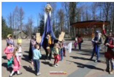
• 2017-04-01-Teatralne powitanie wiosny