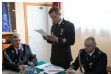
• 2017-03-05-Walne Zebranie Sprawozdawcze OSP Ponice