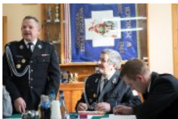
• 2017-03-05-Walne Zebranie Sprawozdawcze OSP Ponice