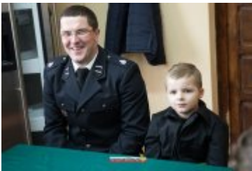
• 2017-03-05-Walne Zebranie Sprawozdawcze OSP Ponice