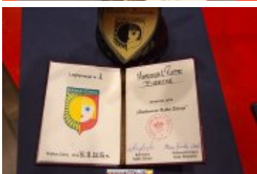
OSOBOWOŚĆ RABKI-ZDROJU - GALA W KINIE ŚNIEŻKA