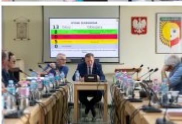
• 2024-05-28-III Sesja Rady Miejskiej w Rabce-Zdroju