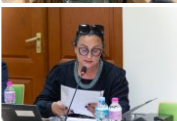
• 2024-05-28-III Sesja Rady Miejskiej w Rabce-Zdroju