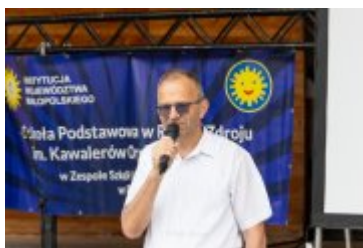
2024-06-03- Dzień Dziecka w Rabce-Zdroju cz.2