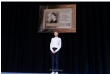
• 2024-05-29-XXXVIII Konkurs Recytatorski im. Antoniny Zachary-Wnękowej cz.1