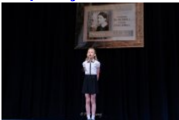
• 2024-05-29-XXXVIII Konkurs Recytatorski im. Antoniny Zachary-Wnękowej cz.1