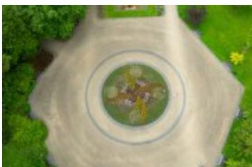
• 2024-05-29-Rabczański Park Zdrojowy pełen tysięcy kwiatów!