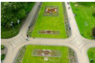
• 2024-05-29-Rabczański Park Zdrojowy pełen tysięcy kwiatów!