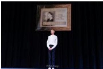
• 2024-05-29-XXXVIII Konkurs Recytatorski im. Antoniny Zachary-Wnękowej cz.1