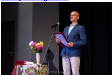
• 2024-05-29-XXXVIII Konkurs Recytatorski im. Antoniny Zachary-Wnękowej cz.1