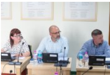
• 2024-05-28-III Sesja Rady Miejskiej w Rabce-Zdroju