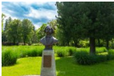
• 2024-05-29-Rabczański Park Zdrojowy pełen tysięcy kwiatów!