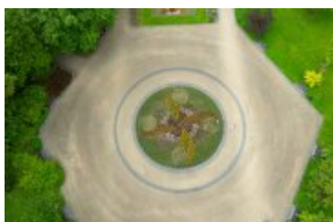
• 2024-05-29-Rabczański Park Zdrojowy pełen tysięcy kwiatów!