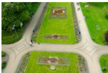
• 2024-05-29-Rabczański Park Zdrojowy pełen tysięcy kwiatów!