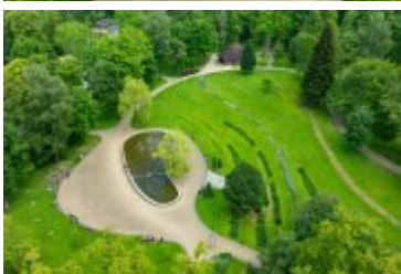
• 2024-05-29-Rabczański Park Zdrojowy pełen tysięcy kwiatów!