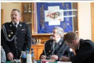
• 2017-03-05-Walne Zebranie Sprawozdawcze OSP Ponice