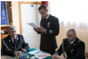
• 2017-03-05-Walne Zebranie Sprawozdawcze OSP Ponice