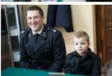
• 2017-03-05-Walne Zebranie Sprawozdawcze OSP Ponice