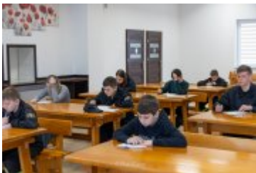
• 2024-03-15-Turniej Wiedzy Pożarniczej