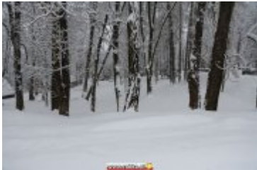
ZIMOWA SCENERIA W UZDROWISKU