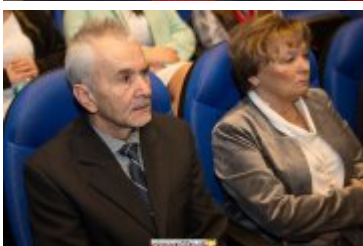
OSOBOWOŚĆ RABKI-ZDROJU - GALA W KINIE ŚNIEŻKA