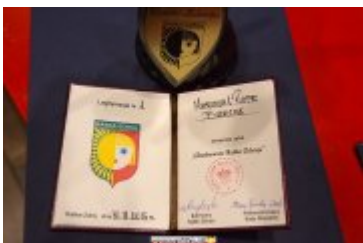
OSOBOWOŚĆ RABKI-ZDROJU - GALA W KINIE ŚNIEŻKA