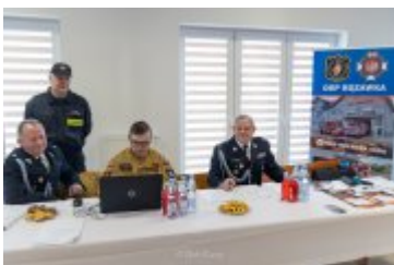
• 2024-03-15-Turniej Wiedzy Pożarniczej