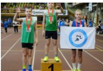
2024-03-06-Zawodnicy UKS Romer na Halowych Mistrzostw