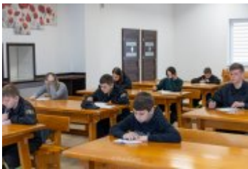
• 2024-03-15-Turniej Wiedzy Pożarniczej