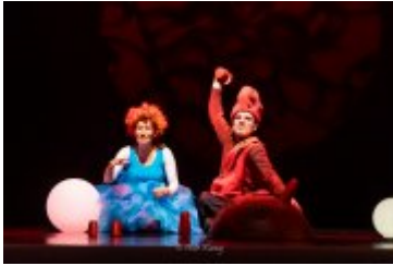
• 2024-03-16-Premiera spektaklu Luna w Teatrze Lalek Rabcio