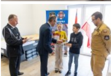
• 2024-03-15-Turniej Wiedzy Pożarniczej