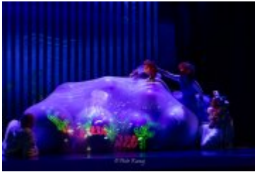
• 2024-03-16-Premiera spektaklu Luna w Teatrze Lalek Rabcio