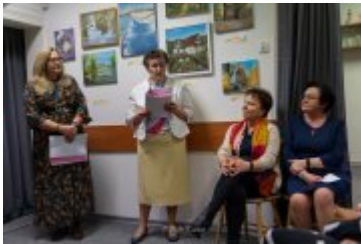
2024-03-06-Dzień Kobiet w RUTW