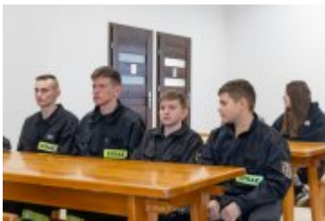
• 2024-03-15-Turniej Wiedzy Pożarniczej