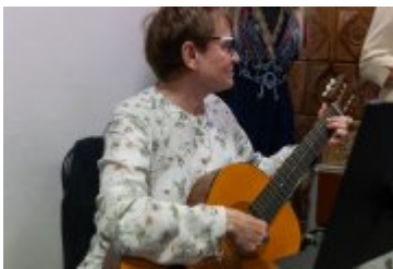
2024-03-06-Dzień Kobiet w RUTW