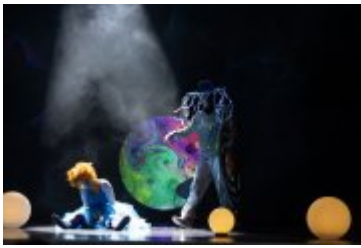
• 2024-03-16-Premiera spektaklu Luna w Teatrze Lalek Rabcio