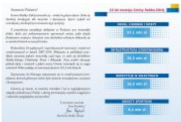
• 2017-03-01-10 lat rozwoju gminy Rabka-Zdrój