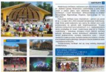
• 2017-03-01-10 lat rozwoju gminy Rabka-Zdrój