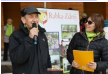
• 2017-02-28-IV Ogólnopolska Zimowa Senioriada na Podhalu - dzień 2 - zakończenie