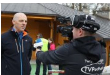
• 2017-02-28-IV Ogólnopolska Zimowa Senioriada na Podhalu - dzień 2 - zakończenie