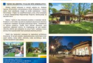
• 2017-03-01-10 lat rozwoju gminy Rabka-Zdrój