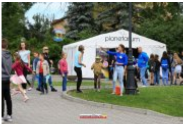
• 2017-06-07-V Festiwal Piosenki Angielskiej