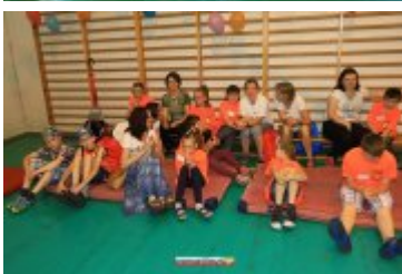
• 2017-06-06-XV Spartakiada Integracyjna Dzieci i Młodzieży