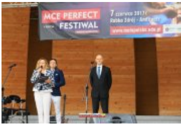
• 2017-06-07-V Festiwal Piosenki Angielskiej