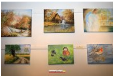
• 2017-06-11-VI Otwarte Dni Seniora