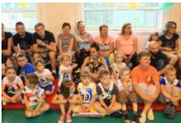
• 2017-06-06-XV Spartakiada Integracyjna Dzieci i Młodzieży