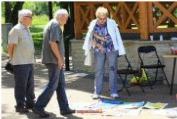
• 2017-06-11-VI Otwarte Dni Seniora