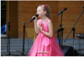
• 2017-06-07-V Festiwal Piosenki Angielskiej