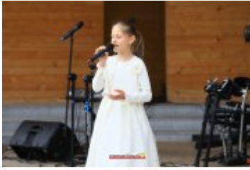
• 2017-06-07-V Festiwal Piosenki Angielskiej