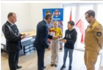
• 2024-03-15-Turniej Wiedzy Pożarniczej