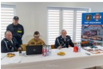
• 2024-03-15-Turniej Wiedzy Pożarniczej