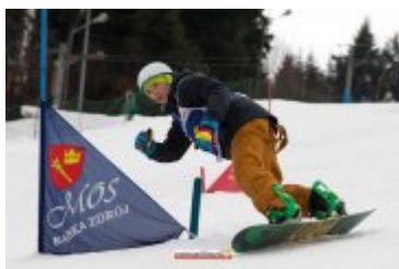
• 2017-02-21-Licealiada w snowboardzie na stoku Polczakówka