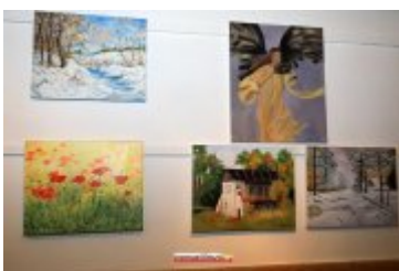
• 2017-06-11-VI Otwarte Dni Seniora