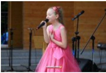
• 2017-06-07-V Festiwal Piosenki Angielskiej