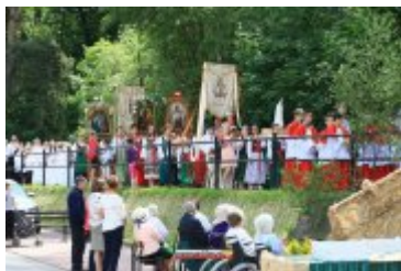
2017-06-15-Procesja Bożego Ciała w parafii św. Teresy