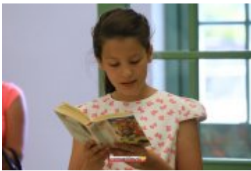
• 2016-06-12-VII edycja konkursu "Pięknego czytania"