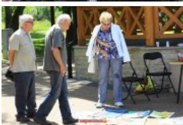
• 2017-06-11-VI Otwarte Dni Seniora