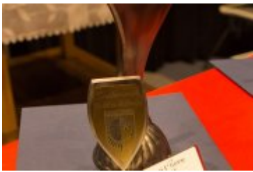
OSOBOWOŚĆ RABKI-ZDROJU - GALA W KINIE ŚNIEŻKA