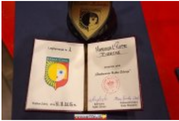
OSOBOWOŚĆ RABKI-ZDROJU - GALA W KINIE ŚNIEŻKA