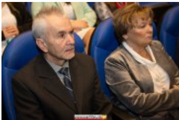
OSOBOWOŚĆ RABKI-ZDROJU - GALA W KINIE ŚNIEŻKA