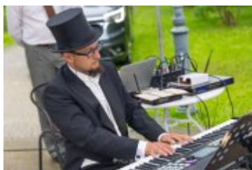
• 2024-06-16- Dawnej Rabki Czar