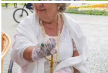
• 2024-06-16- Dawnej Rabki Czar