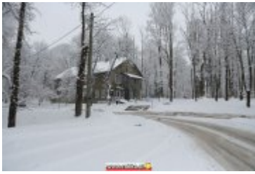
ZIMOWA SCENERIA W UZDROWISKU