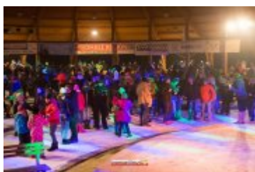
• Sylwester-Powitanie Nowego 2017 Roku