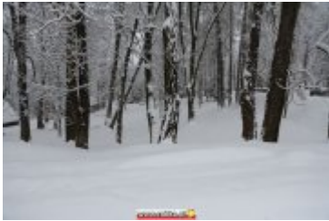
ZIMOWA SCENERIA W UZDROWISKU