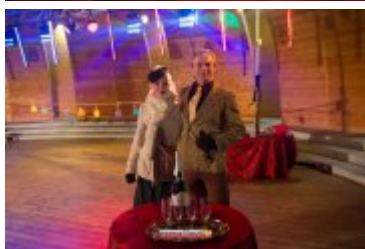
• Sylwester-Powitanie Nowego 2017 Roku