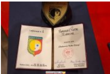
OSOBOWOŚĆ RABKI-ZDROJU - GALA W KINIE ŚNIEŻKA