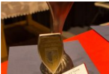
OSOBOWOŚĆ RABKI-ZDROJU - GALA W KINIE ŚNIEŻKA