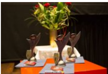
OSOBOWOŚĆ RABKI-ZDROJU - GALA W KINIE ŚNIEŻKA