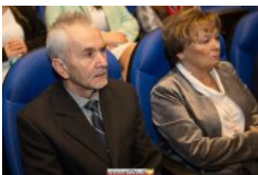
OSOBOWOŚĆ RABKI-ZDROJU - GALA W KINIE ŚNIEŻKA