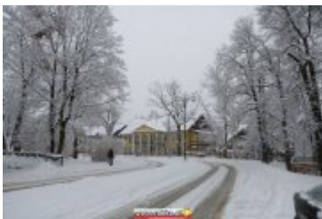
ZIMOWA SCENERIA W UZDROWISKU