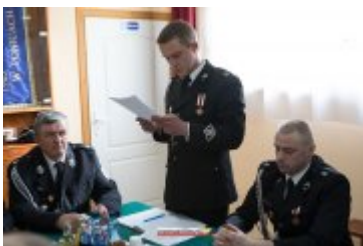
• 2017-03-05-Walne Zebranie Sprawozdawcze OSP Ponice