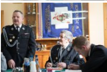
• 2017-03-05-Walne Zebranie Sprawozdawcze OSP Ponice