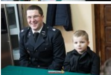
• 2017-03-05-Walne Zebranie Sprawozdawcze OSP Ponice