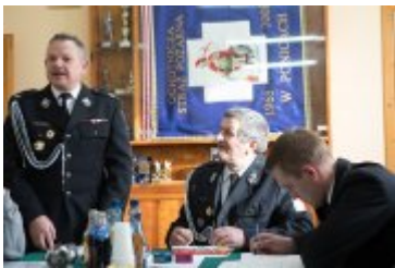
• 2017-03-05-Walne Zebranie Sprawozdawcze OSP Ponice