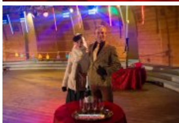
Sylwester-Powitanie Nowego 2017 Roku