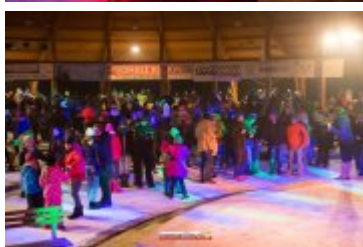
Sylwester-Powitanie Nowego 2017 Roku