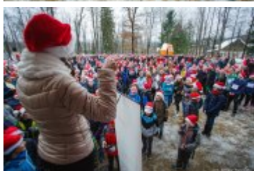
• 2017-12-06-I Bieg Mikołajów cz.1