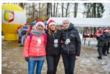
• 2017-12-06-I Bieg Mikołajów cz.1