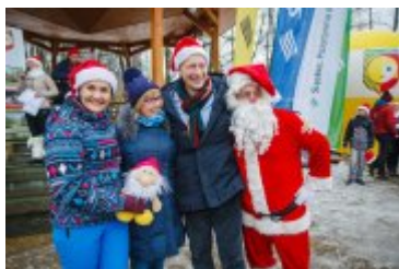
• 2017-12-06-I Bieg Mikołajów cz.2