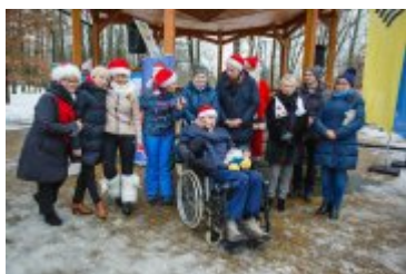
• 2017-12-06-I Bieg Mikołajów cz.2