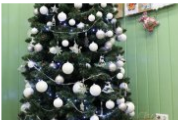
• 2017-12-06-XIII Ogólnopolski Konkurs na „List do Św. Mikołaja”