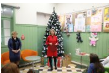
• 2017-12-06-XIII Ogólnopolski Konkurs na „List do Św. Mikołaja”