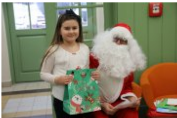
• 2017-12-06-XIII Ogólnopolski Konkurs na „List do Św. Mikołaja”