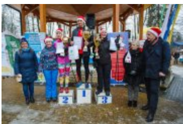
• 2017-12-06-I Bieg Mikołajów cz.2