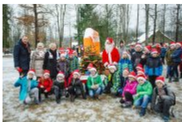
• 2017-12-06-I Bieg Mikołajów cz.1