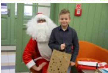
• 2017-12-06-XIII Ogólnopolski Konkurs na „List do Św. Mikołaja”