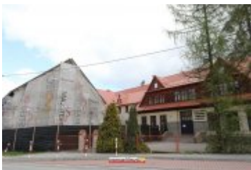
• 2017-05-09-Budowa sali gimnastycznej w Ponicach