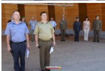
• 2017-05-28-II Mundurowy Dzień Dziecka