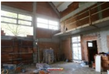
• 2017-05-09-Budowa sali gimnastycznej w Ponicach