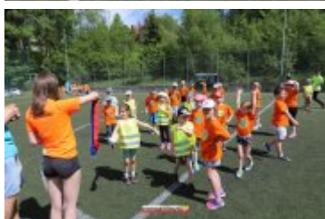
• 2017-05-29-Dzień Dziecka na sportowo na rabczańskim Orliku