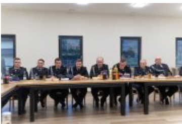
• 2024-02-11-Walne zebranie w OSP Ponice