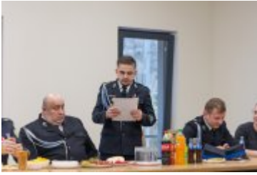
• 2024-02-11-Walne zebranie w OSP Ponice