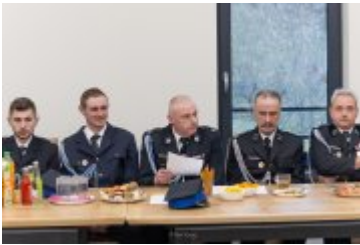
• 2024-02-11-Walne zebranie w OSP Ponice