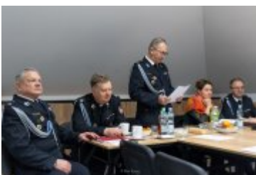
• 2024-01-04-Zebranie sprawozdawcze jednostki OSP w Chabówce