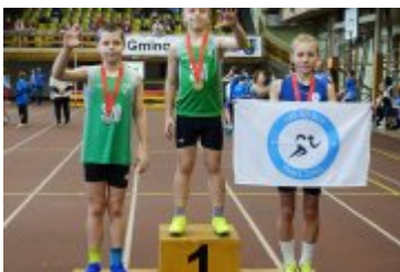
2024-03-06-Zawodnicy UKS Romer na Halowych Mistrzostw