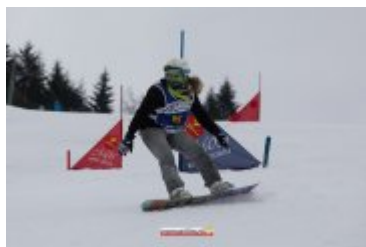
• 2017-02-21-Licealiada w snowboardzie na stoku Polczakówka