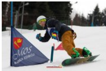
• 2017-02-21-Licealiada w snowboardzie na stoku Polczakówka