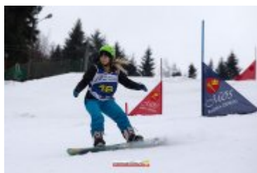
• 2017-02-21-Licealiada w snowboardzie na stoku Polczakówka