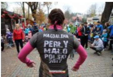
• 2017-10-22-Perły Małopolski-cześć 1