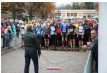
• 2017-10-22-Perły Małopolski-cześć 2