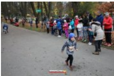
• 2017-10-22-Perły Małopolski-cześć 1