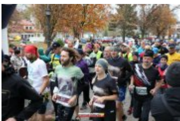
• 2017-10-22-Perły Małopolski-cześć 2