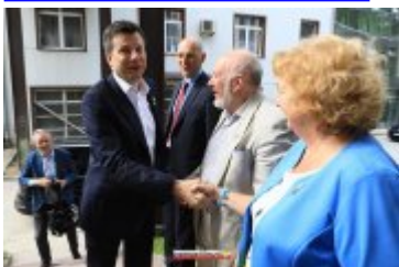
• 2017-06-13-Wizyta Rzecznika Praw Dziecka Marka Michalaka w rabczańskich szkołach