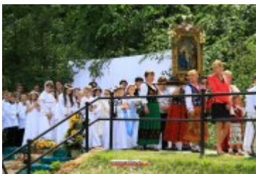
• 2017-06-15-Procesja Bożego Ciała w parafii św. Teresy