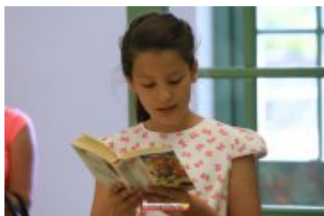
• 2016-06-12-VII edycja konkursu "Pięknego czytania"