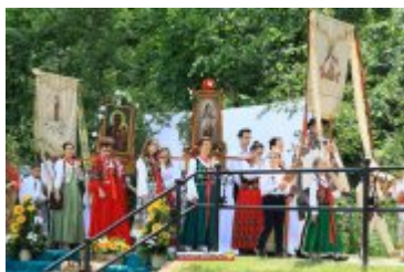
2017-06-15-Procesja Bożego Ciała w parafii św. Teresy