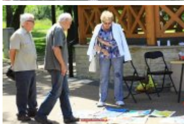
• 2017-06-11-VI Otwarte Dni Seniora