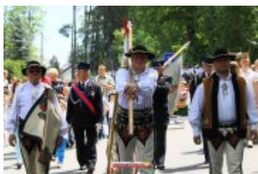
2017-06-15-Procesja Bożego Ciała w parafii św. Teresy