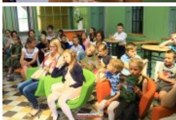
• 2016-06-12-VII edycja konkursu "Pięknego czytania"